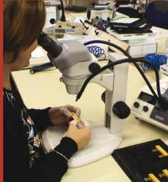
La PME Egide fabrique des boîtiers hermétiques utilisés pour la protection de puces électroniques ou électromagnétiques à des fins militaires (avions de combat, drones, blindés) comme civiles (réseaux de télécommunication, satellites)

Mis en œuvre par la direction générale de l'armement depuis 2009 en partenariat avec la direction générale de la compétitivité, de l'industrie et des services (DGCIS), le dispositif RAPID (régime d'appui pour l'innovation duale) soutient les projets technologiques innovants proposés par une PME ou une ETI de moins de 2000 personnes (seule ou en consortium) et présentant des applications dans le domaine militaire mais aussi sur les marchés civils. RAPID est le seul dispositif du ministère de la Défense dédié spécifiquement aux PME et aux ETI. Il permet de soutenir l'innovation duale, sachant que la quasi-totalité des PME et ETI travaillant pour le marché de la défense ont une activité duale. Il dispose d'une enveloppe de 40 millions d'euros pour 2012, dont le montant est confirmé pour 2013. Cette enveloppe sera progressivement portée de 40 à 50 millions d'euros sur la période 2013-2015. Des actions complémentaires seront engagées par la direction générale de l'armement pour susciter un volume croissant de projets soumis par les PME.